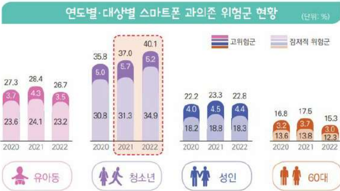
연도별 대상별 스마트폰 과의존 위험군 현황

- 전년대비 가장 많이 상승한 과의존위험군 연령대는 청소년(3.1%p)로 나타남