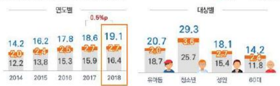
연도별·대상별 스마트폰 과의존위험군 현황(%)