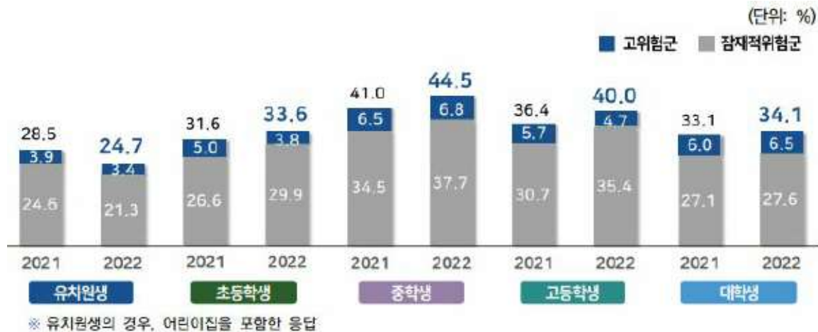
학령별 스마트폰 과의존위험군 비율

- 학령별 스마트폰 과의존위험군 비율은 중학생(44.5%), 고등학생(40.0%), 대학생(34.1%), 초등학생(33.6%), 유치원(24.7%) 순으로 중학생이 가장 취약함