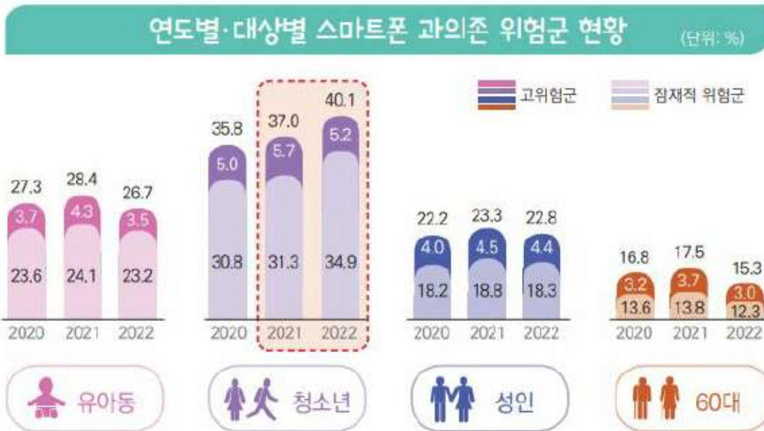
연도별 대상별 스마트폰 과의존 위험군 현황

※ 출처: 2022 스마트폰 과의존 실태조사_과학기술정보통신부, 한국지능정보사회진흥원